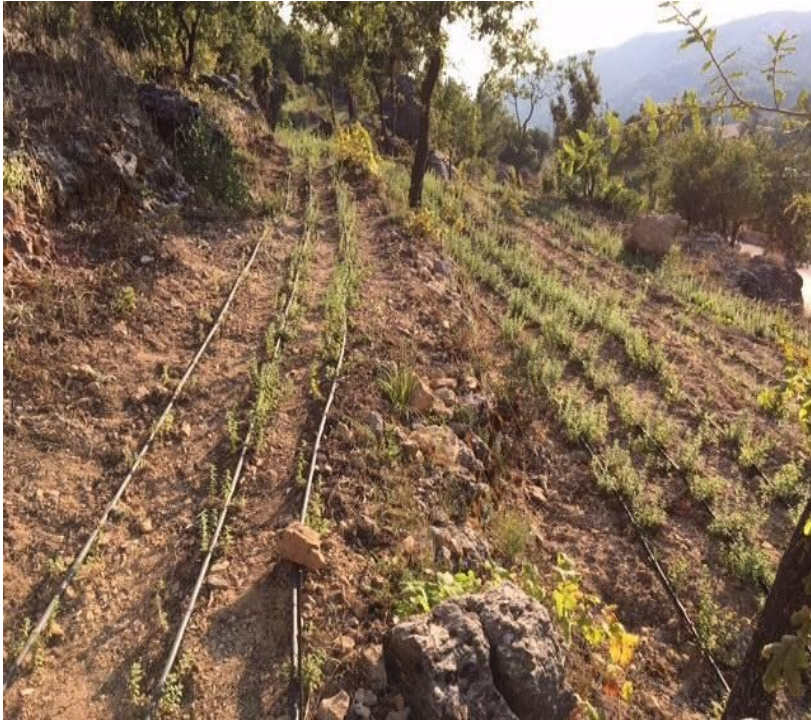
2016/17: 1 er terrain porté à 3000 m2