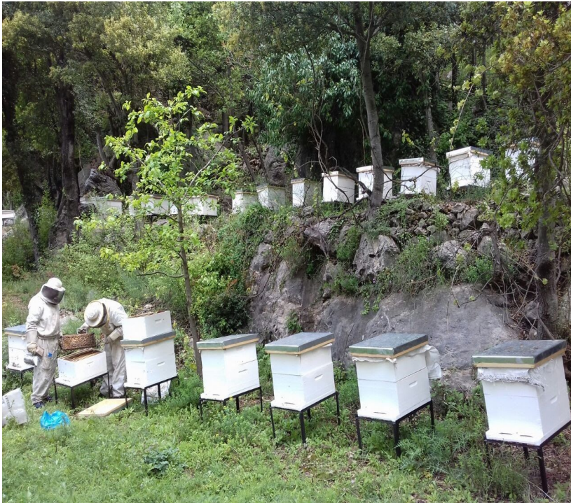
Une miellerie bien équipée