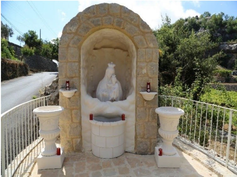
Notre-Dame de la forteresse