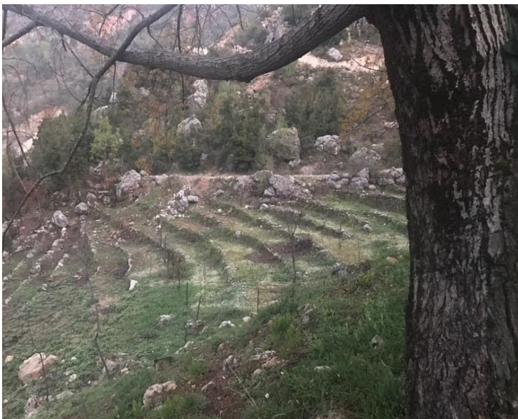
2018 : 2 ème terrain de 2000 m2