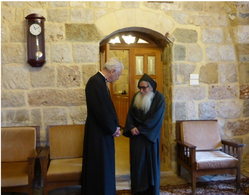
Mgr Aumonier avec l'ermite du monastère St Antoine de Khozaya