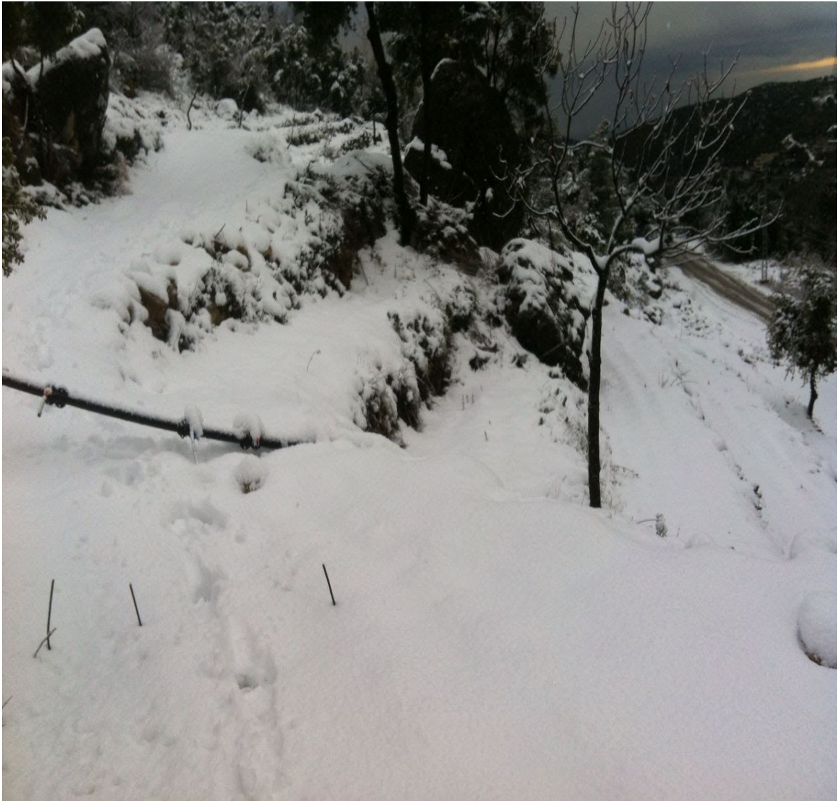
Le Zaatar enneigé (janvier 2017)