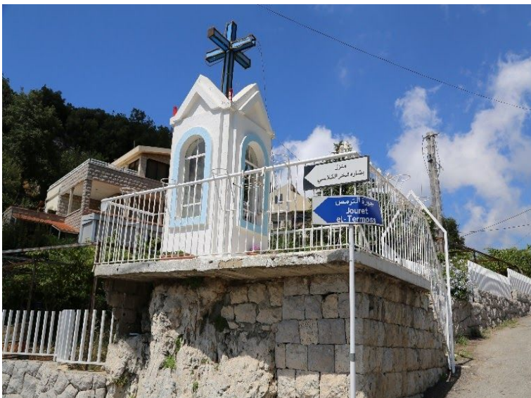
Notre-Dame de l'assomption