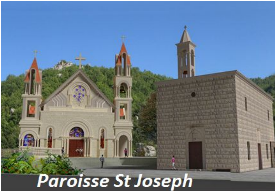
Paroisse St Joseph