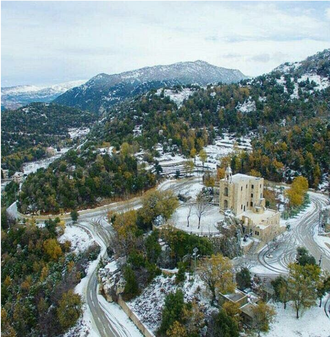
Chahtoul sous la neige (janvier 2017)